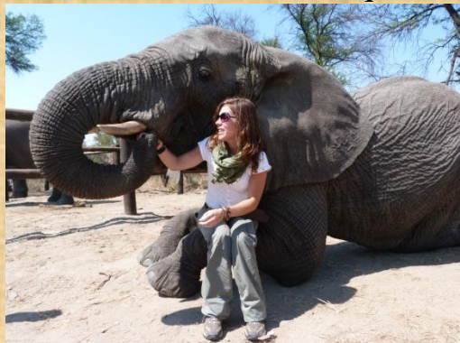
Elefantes en Gweru.