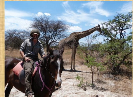
Safari a caballo en Antelope Park