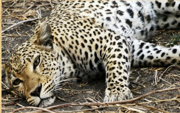
Leopardo en Chobe N.P.