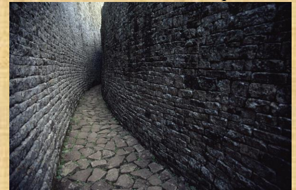
Ruinas de Gran Zimbabwe