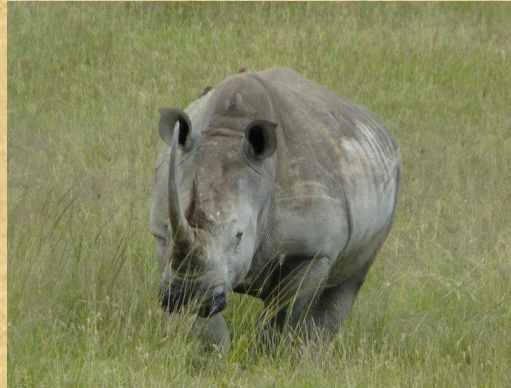
Rinoceronte en Matopos N.P.