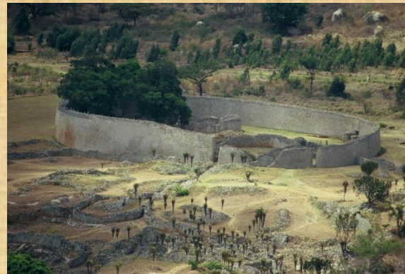
Ruinas de Gran Zimbabwe