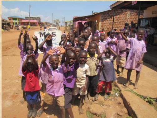
Vida en Uganda