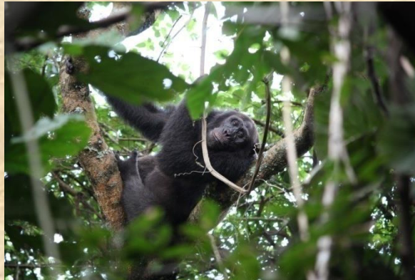
Chimpance en el Bosque de Budongo