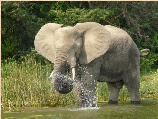
Elefante a orillas del Canal de Kazinga