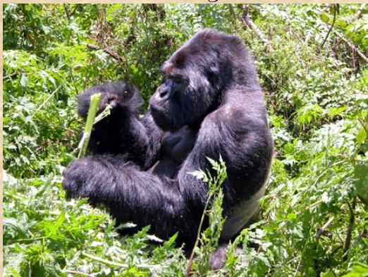
Gorilas de montaña