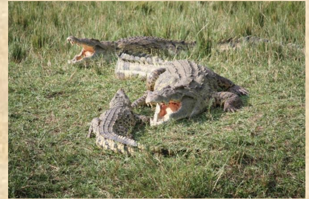
Cocodrilos en el rio Nilo