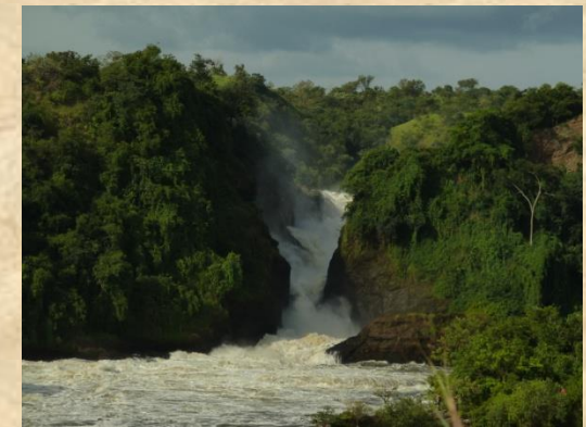
Cataratas Murchison. Uganda