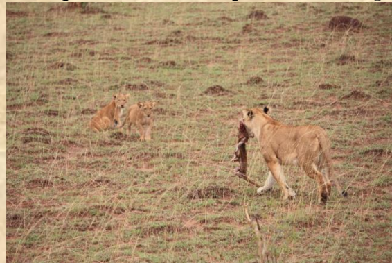
Leones en Queen Elisabeth N.P.