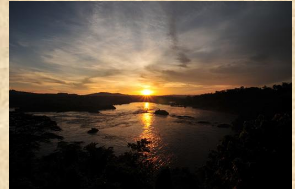
Atardecer sobre el rio Nilo