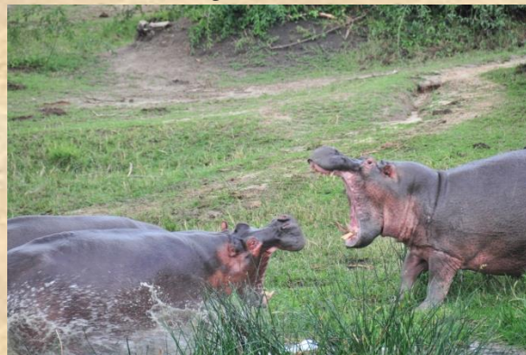
Hipopótamos en Canal de Kazinga