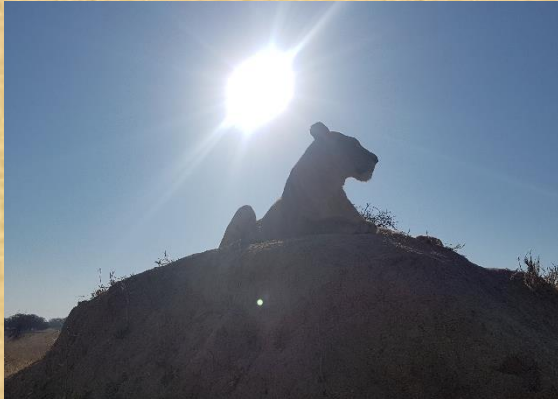
Encuentro con leones.