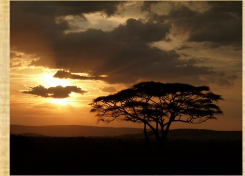
Puesta de sol en Tanzania