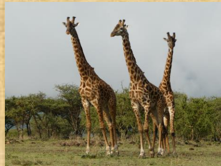
Jirafas en Lago Manyara