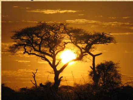
Amanecer en Serengeti