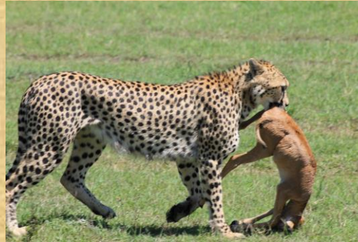
Guepardo con su presa en Serengeti