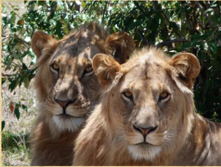
Leones en el Serengeti