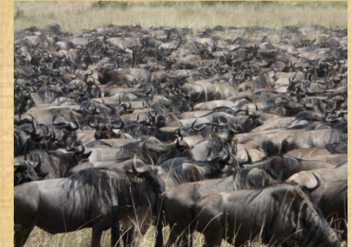
La gran migración