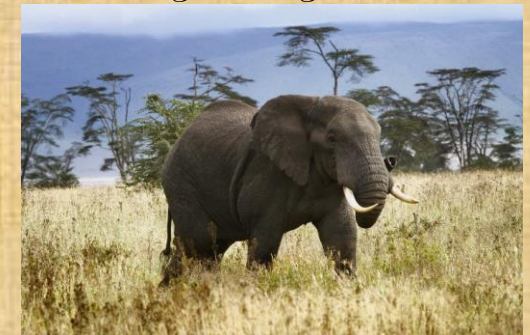
Elefante en el N'Gorongoro